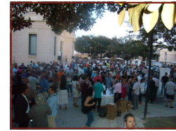
Autoridades y numeroso público asistente