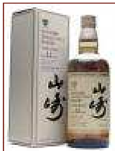
Japón Single malt 7.8 / 10

No es un aprendizaje sencillo, pues el master blender debe de ser capaz de distinguir multitud de aromas y encontrar la combinación exacta para la integridad de la marca; son auténticos perfumistas, con una prodigiosa nariz que deben cuidar. Posiblemente sea el oficio donde más años hay que echarse como aprendiz, antes de ganarse el título.